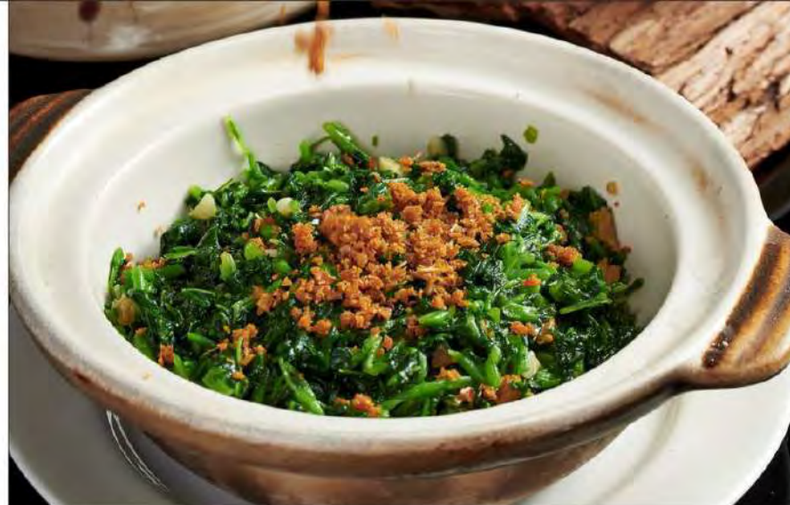
粒粒苋菜煲 Signature Minced Chinese Spinach