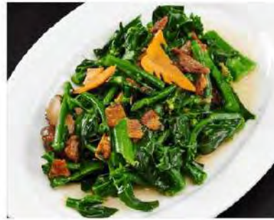
鯷鲷芥兰 Stir-Fried Kailan W Dried Sole Fish $22 12.8 $30 16.8

图片仅供参考, 出品以实物为准。 The pictures are for reference only, it subject to the actual product