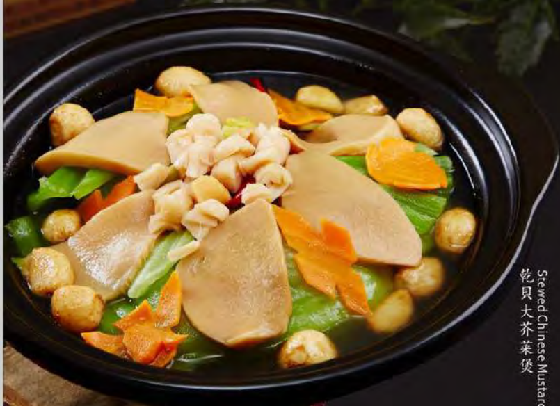
乾貝大芥菜煲 Stewed Chinese Mustard in Claypot