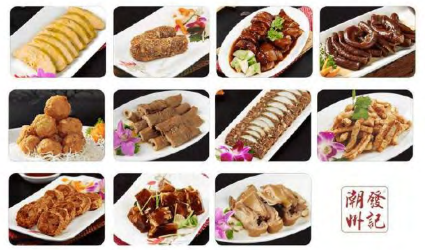
图片仅供参考, 出品以实物为准。 The pictures are for reference only, it subject to the actual product