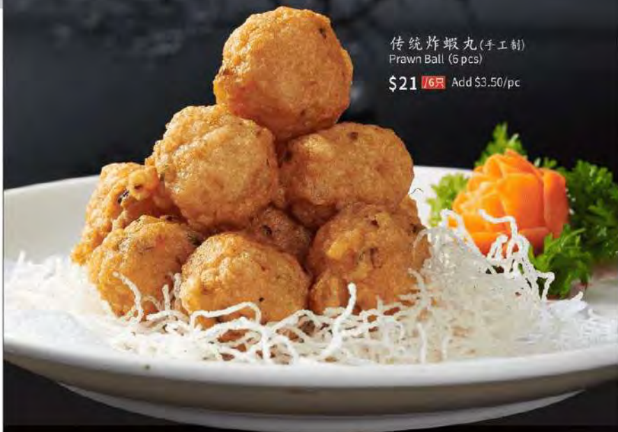
传统炸蝦丸(手工制) Prawn Ball (6 pcs)