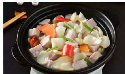
芋頭百合煲 Taro Lily Bulb in Claypot