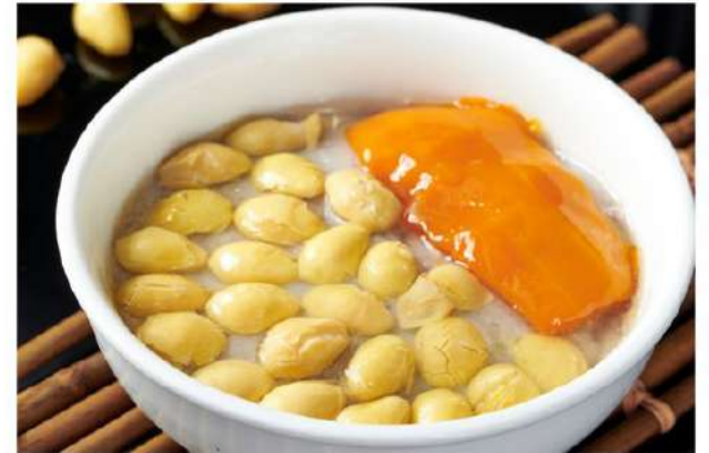
金瓜白果芋泥 Yam Paste w Pumpkin & Ginkgo Nuts