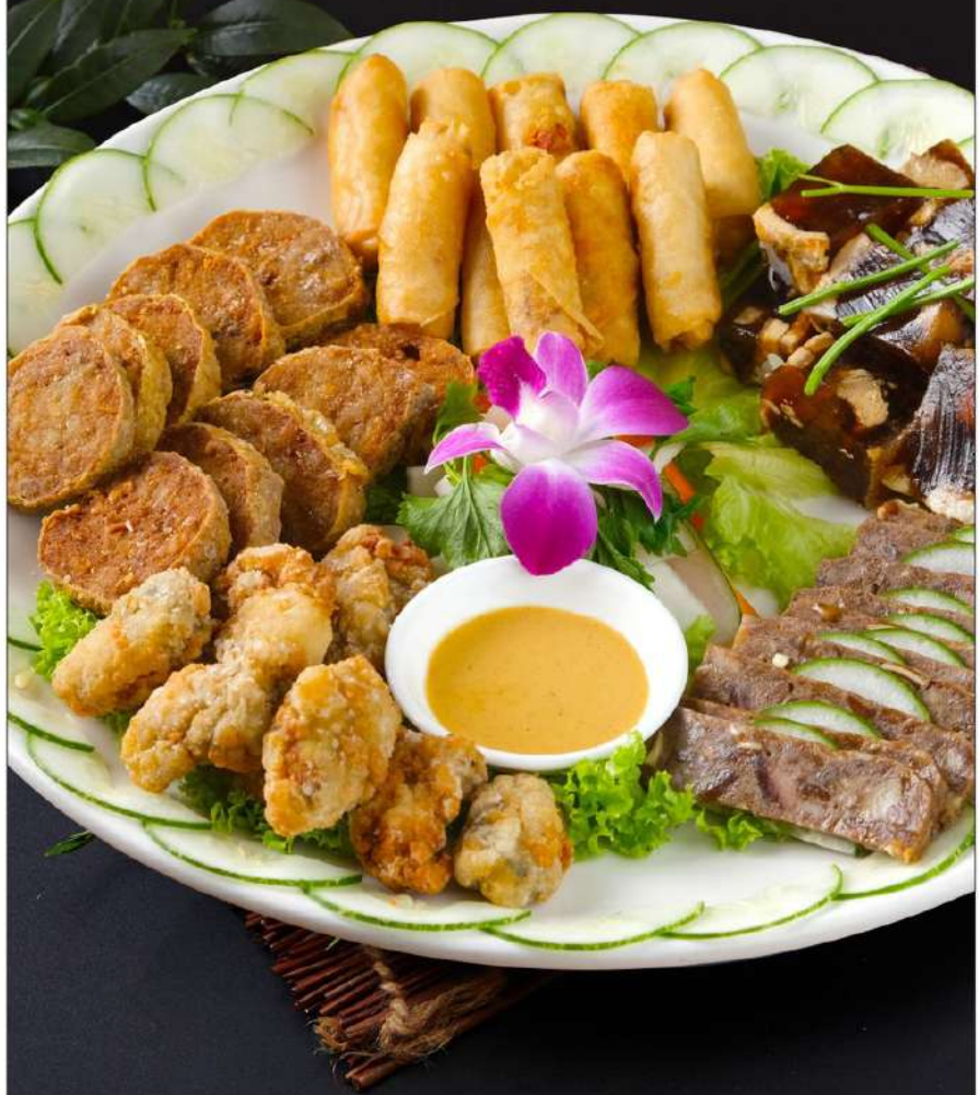
图片仅供参考, 出品以实物为准。 The pictures are for reference only, it subject to the actual product

"卤"的这种烹调方法历史悠久,北魏农食典籍《齐民要术》与宋代食典都有"卤"的烹调方法记载,但目前在我国八大菜系中使用并不普遍,除了"潮菜",潮汕卤味的制作,可以说源远流长,制作讲究。