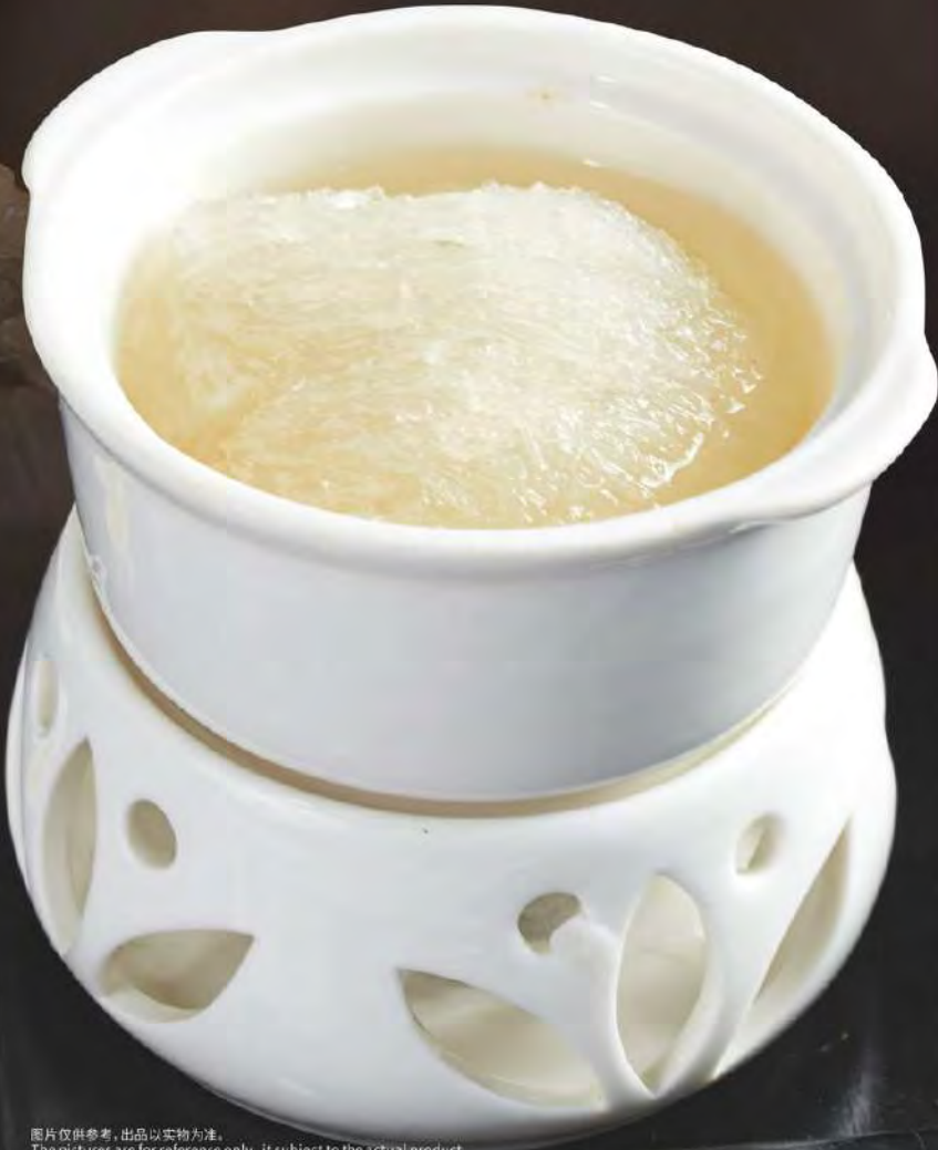
图片仅供参考，出品以实物为准。 The pictures are for reference only, it subject to the actual product