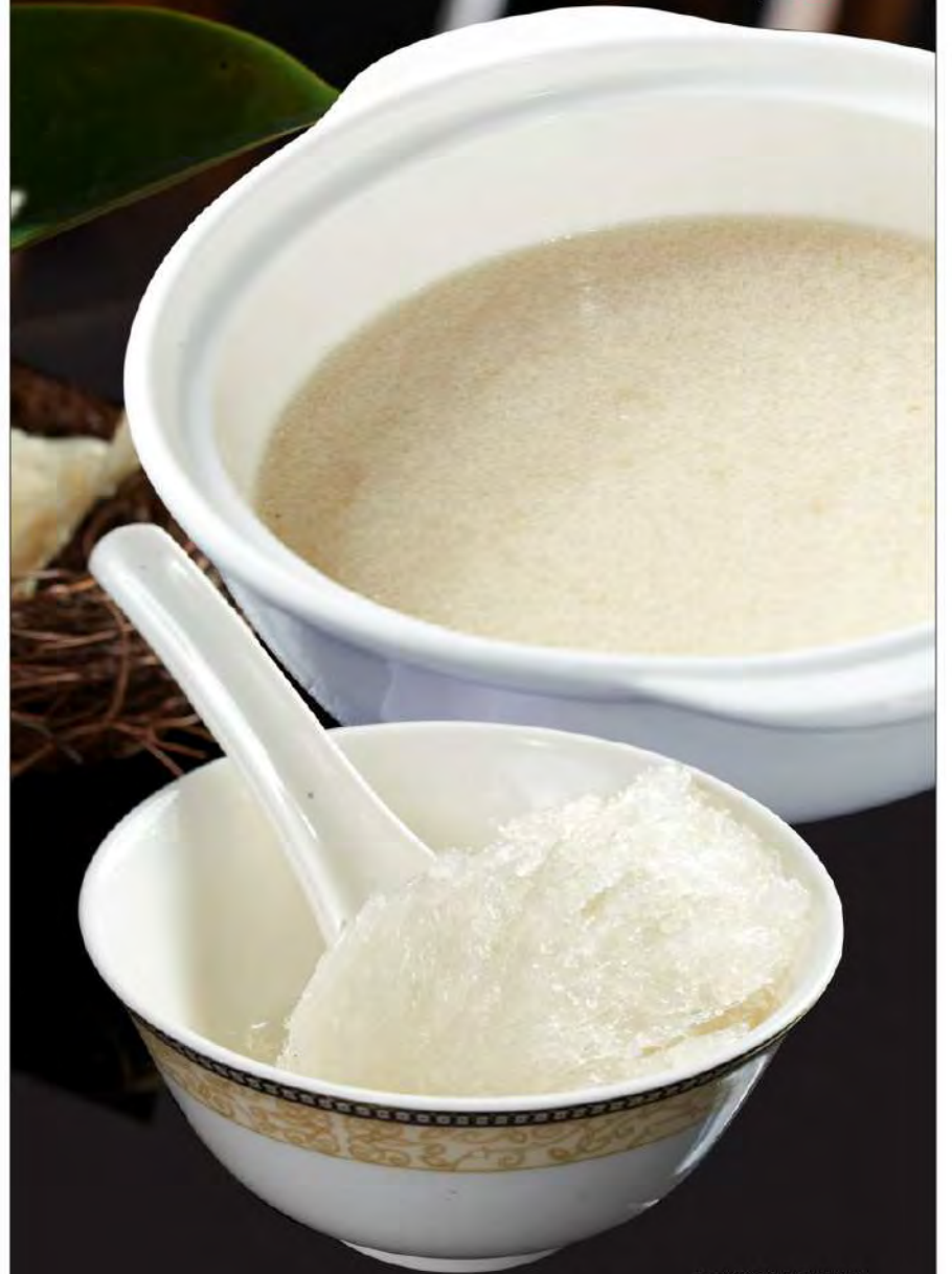
图片仅供参考，出品以实物为准。 The pictures are for reference only, it subject to the actual product