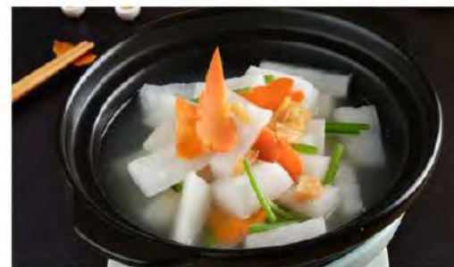
清湯蘿蔔煲 White Radish in Claypot