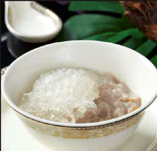
芋泥燕窩 Bird's Nest with Yam Paste