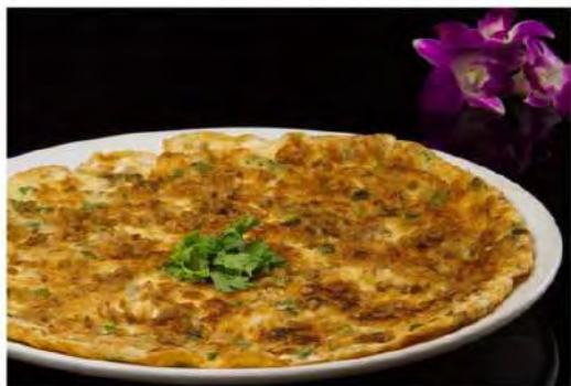
Cnye Pohn Omelette 芥脯蛋