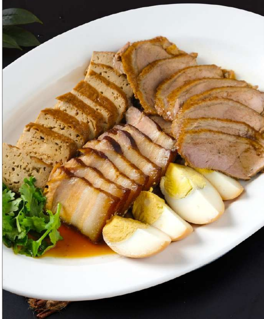
图片仅供参考, 出品以实物为准。 The pictures are for reference only, it subject to the actual product

"卤"的这种烹调方法历史悠久,北魏农食典籍《齐民要术》与宋代食典都有"卤"的烹调方法记载,但目前在我国八大菜系中使用并不普遍,除了"潮菜",潮汕卤味的制作,可以说源远流长,制作讲究。