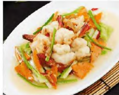
韭菜白炒蝦球 Stir-Fried White Chives W Prawn $30 12.8 $45 16.8