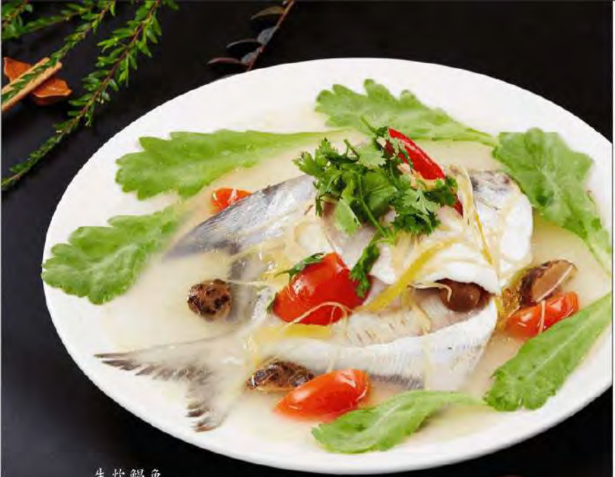
生炊鲷鱼 Signature Steamed Pomfret $12 100g