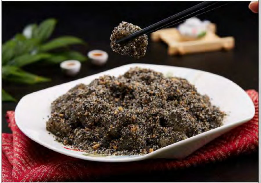
麻滋 Muah Chee