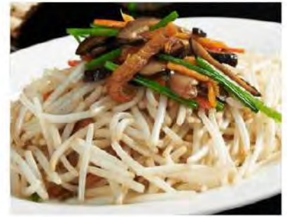
豆芽咸鱼 Sautéed Bean Sprouts W Salted Fish $22 12.8