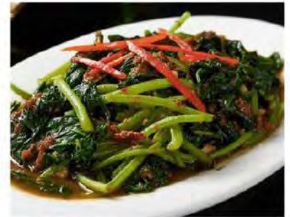
三邑番薯叶 Stir-Fried Sweet Potato Leaves W Sambal $20 12.8 $25 16.8