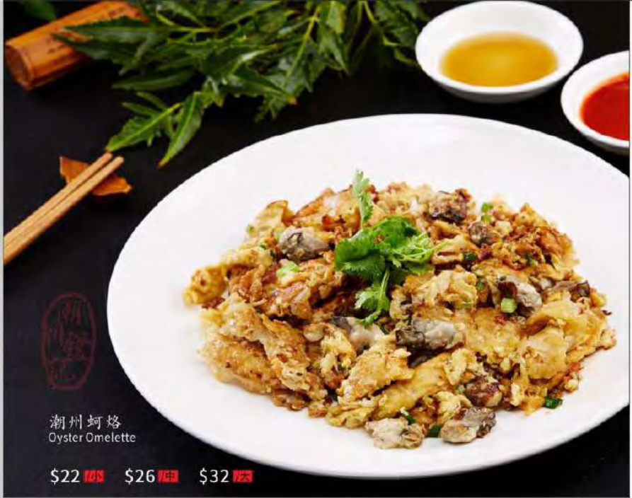
潮州蚵烙 Oyster Omelette