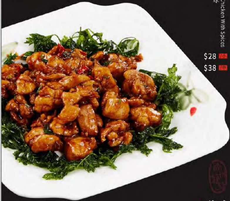
川椒鸡球 Boneless Chicken With Spices