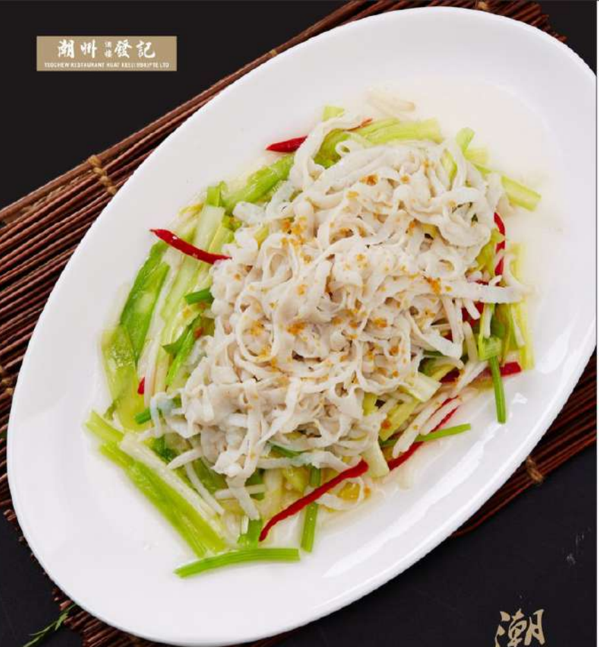
传统手工鱼麵 Handmade Fish Noodles With Chives & Bean Sprouts