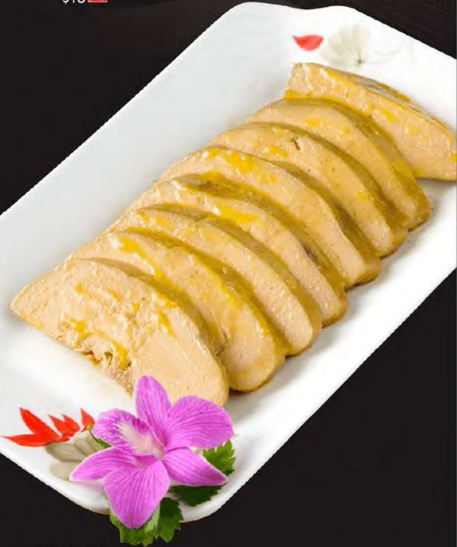
图片仅供参考, 出品以实物为准。 The pictures are for reference only, it subject to the actual product