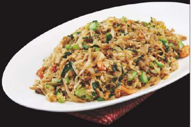
Assorted Vegetables w/ Stir-Fried Noodles 桂花炒麵