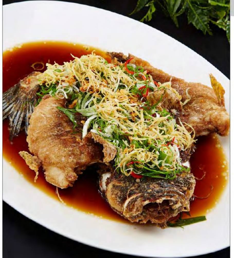
图片仅供参考, 出品以实物为准。 The pictures are for reference only, it's subject to the actual product