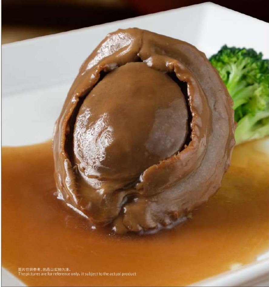
图片仅供参考, 出品以实物为准。 The pictures are for reference only, it subject to the actual product