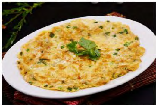
White Bait Omelette 銀魚燕窩