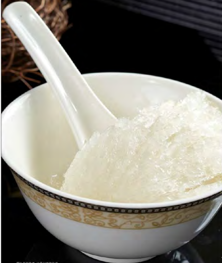
图片仅供参考, 出品以实物为准。 The pictures are for reference only, it's subject to the actual product

许多中医名药之中就有记载，燕窝对于肺部疾病、呼吸系统进行具有很好的治疗作用。常见的就有咳嗽、肺炎、哮喘等病，这些症状也就是我们现在常说的肺尘埃、尘气、管炎以及气管炎等等，燕窝对于我们的身体具有非常好的滋补作用。