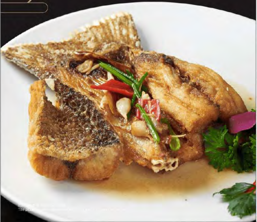
半煎煮午鱼尾 Pan-fried Threadfin Fish w Soybean Sauce 时价