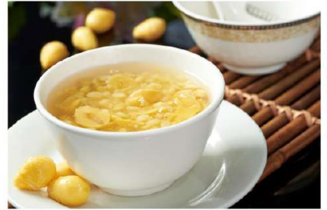
豆爽油条 Tau Suan w Fried Fritters