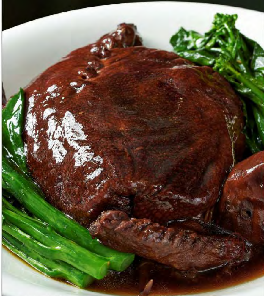
图片仅供参考，出品以实物为准。 The pictures are for reference only, it's subject to the actual product