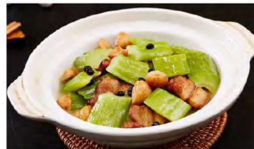
花腩苦瓜煲 Stewed Bitter Gourd in Claypot