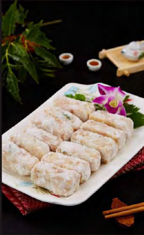
反沙芋 (8支) Glazed Yam Sticks (8pcs)