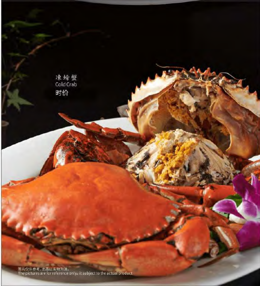
凍螃蟹 Cold Crab 时价

图片仅供参考, 出品以实物为准。 The pictures are for reference only, it subject to the actual product